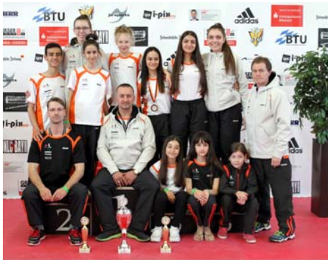
TSV 1865 Dachau

Die Pokale für die Kadetten (10 x Gold, 3 x Silber, 6 x Bronze) und die Junioren (6 x Gold, 6 x Silber, 13 x Bronze) gingen mit deutlichem Abstand an die BTU vor der